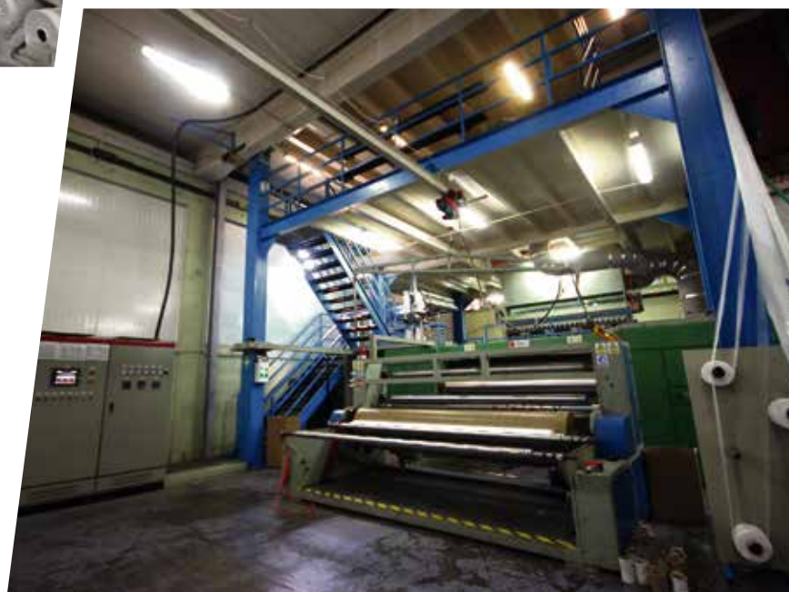
Skladištenje / ambalažiranje